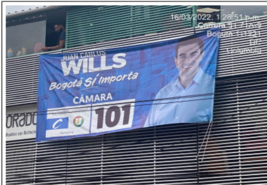
Un (1) Aviso en Fachada ubicado en un inmueble, sobre la KR 51 calzada oriental