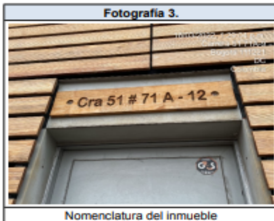
Nomenclatura del inmueble